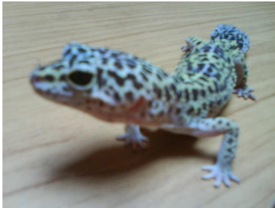
moja Nirvana Al Kaida

Živali... bitja, zaradi katerih je ta svet lepši. Skrbeti zanje mi pomeni veliko in poleg vseh drugih ljubljencev, ki me obdajajo, sem si zaželela še eksotične živali. Pravi zame? Gekon s črnimi pikami/črtami na rumeni podlagi - prelepa žival... Leopardji gekon ( eublepharis macularis )